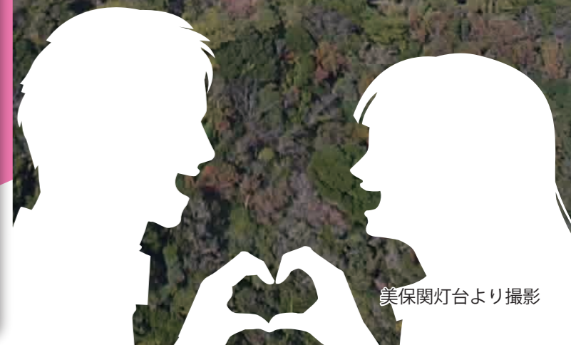
美保関灯台より撮影