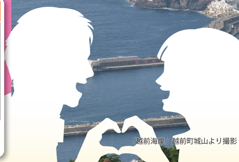
「越前海岸」越前町城山より撮影

越前町は、福井県嶺北地方の西端に位置し、日本海と丹生山地に囲まれた自然豊かなまちです。町の伝統工芸である「越前焼」は日本六古窯のひとつで日本遺産に認定されています。恋する灯台がある越前岬は、高台から日本海を一望できる絶景スポットで、夕暮れ時のマジックアワーは美しく、幻想的で、見ている二人をキュンとさせます。二人の仲をより深めるために、ぜひ越前町へお越しください。